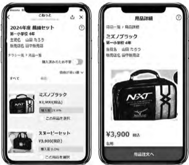
発注時のスマートフォン画面

の御朱印帳。近年、御朱印人気の高まりによる混雑の緩和や感染症対策などを目的として、紙に書いた書き置き御朱印を取り扱う寺社が増加。また、切り絵や刺しゅうなど、それぞれの寺社が個性を出した書き置き御朱印の人も高まっている。