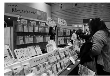
多彩な付箋を展示

〇：ヒサゴ ヒサゴが運営する雑貨ブランド「UN TROIS CINQ (アントワサンク)」より、ふせんの70%をのり面にすることでしっかり貼れてはがれ落ちにくい「しっかり貼れるヒタふせん」、野鳥をデザインした「バードブックマーカー」刺繍しおり、立てられるふせん「立つふせん」など多彩な付箋を展示