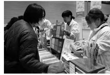
カスタマイズオープンノートの実演

〇：リヒトラフ 限定商品は、オリジナルノートを作ることができる「カスタマイズオープンリングノート」の限定柄を用意。