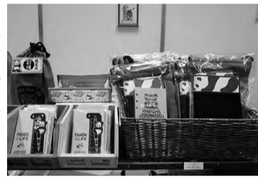
パンダグッズの新アイテム

〇：レイメイ藤井 限定商品は、おなじみの竹紙システム手帳リフィルや、毎年大好評のパンダグッズが今年もかわいいデザインで登場。今回は竹紙リフィルに、同社初の試み