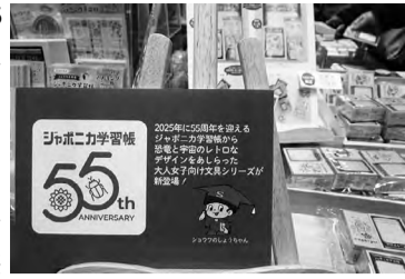
55周年のジャポニカ学習帳

〇：シヨウワノート 限定商品では、2025年に55周年を迎える「ジャポニカ学習帳」から、貼りボニカ学習帳」から、貼り箱付きの限定セット、恐竜と宇宙のレトロなデザイン