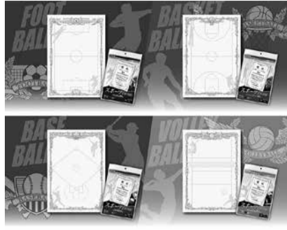
サッカー、バスケ、野球、バレーの4競技で展開するスポーツ賞状用紙

株式会社サカワは、スポーツ賞状用紙を新発売した。スポーツ賞状用紙は、競技人口が多いサッカー、バレー、集団式・卒団式なスケッチボール、野球、バドミントンなど4競技で展開するスポーツ賞状用紙。レーボールの4種で展開し、各スポーツを象徴する飾り枠と躍動感溢れるシルエットをデザイン。個人・団体を問