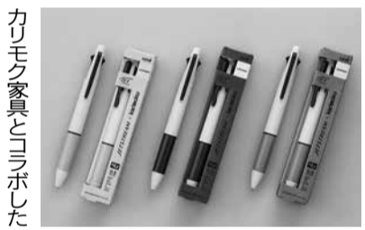
カリモク家具とコラボしたJストリーム

三菱鉛筆株式会社は、油性ボールペン「Jストリーム」シリーズから、カリモク家具株式会社とのコラボレーション第2弾として、「JESTREAM M×karimoku」を数量限定で発売。