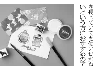
ウキデイの使用例

シャチハタ株式会社は、水性染料インキを弾くスタンプパッド「Ukidei(ウキデイ)」を発売。水性染料インキを弾く特殊インキを採用した白色のスタンプパッド。ウキデイを使用し、手持ちのゴム印を押した印影の上から万年筆インクや水性ペンで塗ると、色を弾いてイラストが