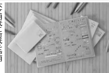
本文用紙に竹紙を使用

◆SNSで新商品の入荷やイベント情報を配信。Instagramでは毎週日曜午後7時よりライブを配信中。リアルタイムのコメントなどに応じて、いろんな情報を伝えています。Instagramのアカウントは@giftionery_delta。Xのアカウントは@giftioneryDelta。フォローをお願い致します。