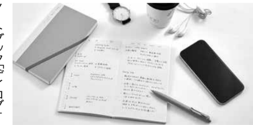
ノートブック「デイログ」

タスク管理や記録を残す 「デイログ」は、見開き1日、毎日の予定やログ、todoなどを書いてタスク管理や記録を残すことができます。 1冊で3カ月分使え、ライフログをやってみたい人も気軽に始められる。表紙