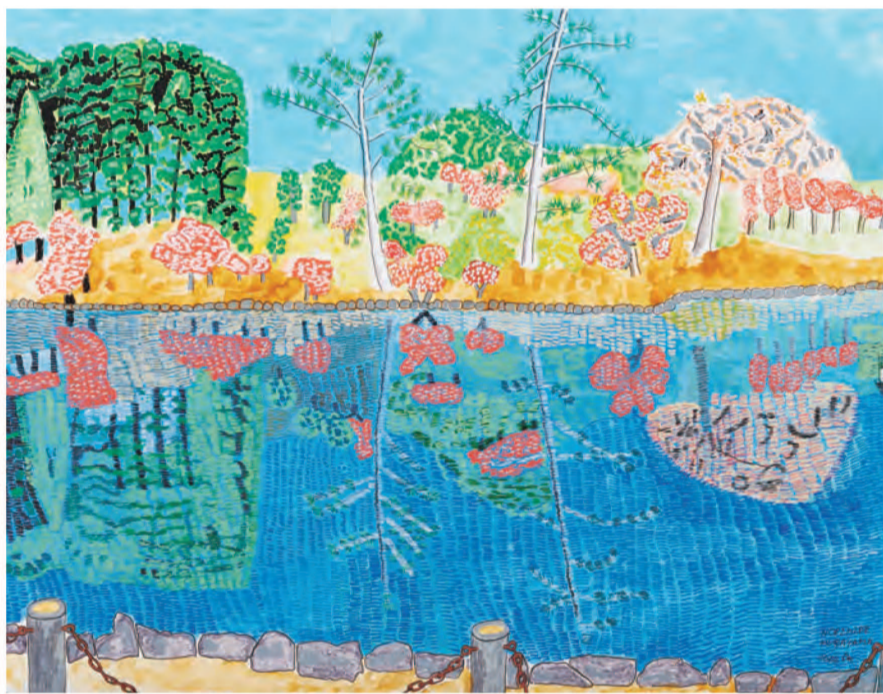
第33回展自由表現部門大阪府知事賞 村山史秀「東大寺鏡池」 ©全日本アートサロン 絵画大賞展

全日本アートサロン 絵画大賞展はサクラクレパス創業70周年記念事業の一環として1991年から実施している公募展。