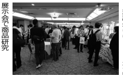
展示会で商品研究