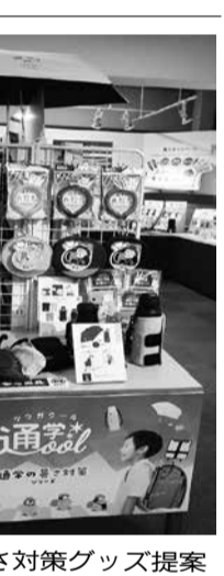
通学の暑さ対策グッズ提案

商談会では、学童文具・筆入れ・ミラガクなどの新入学的アイテムを中心とした提案を行い、女性向け、一般向けの文具商品やキャラクターの新製品など、幅広いラインアップで、秋から冬にかけて発売する新商品127アイテム285点を発表した。