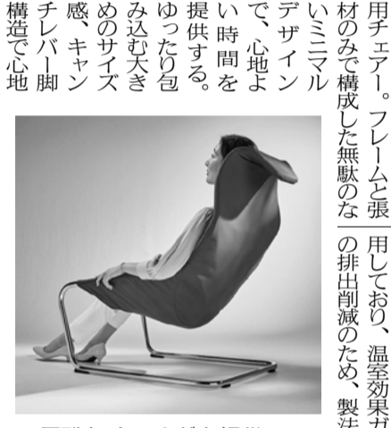
優雅なくつろぎを提供

三菱鉛筆株式会社は、「スター」を発売。 贈答用ではなく自分のために部屋に飾る花「パーソナルフラワー」をテーマに、日常を彩るマットなカラーリングの新軸色。 誰かに贈るためではなく、自分用に飾る花「パーソナルフラワー」をイメージし、