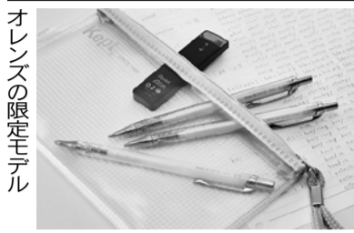
オレンズの限定モデル

どでも人気な、透け感のあるカラーや無機質な風合いのデザインを施した限定モデルを発売。 新商品のオレンズは、後軸からペン先に向かってだんだんと色が薄くなっていくグラデーションがかかった、透け感のあるシアリーなクリアボディ。近年ニーズが高まっている、透明のペンケースに文具を入れて「見せる」シーンでも映える、ニュアンスのあるカラーリングにした。