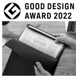
GOOD DESIGN AWARD 2022