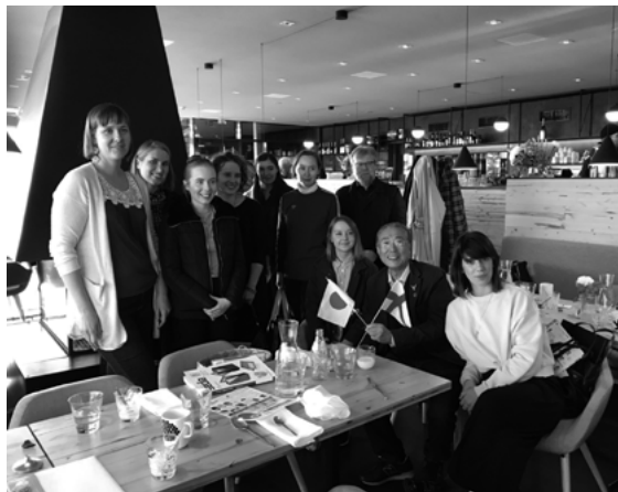
フィンランド在住デザイナーとプレゼンレセプションミーティングをヘルシンキで開催

このように、デザインと機能を徹底的に追求し、常に新たなイノベーションを取り組む風土が今日のセキセイ株式会社の根底に流れているDNAだと思っています。