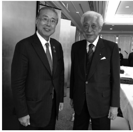
内閣府認証NPO法人JMCAアドバイザーボードの千玄室大宗匠とJMCA西川雅夫理事長