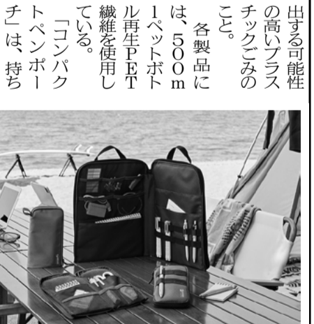
OBP素材を採用して製品化

人と環境に優しい素材で材料や風合いにこだわって選べる7種10アイテムを用意している。 宿泊施設での大切な顧客への案内、店頭でのエンカ商品紹介POP、こだわりの食材を使用した料理のメニュー表などにおすすめ。 レーザプリンタ・インクジェットプリンタ・コピー機対応で、プリンタを選ばず使える。 サステナブルクラブは、サステナブルな社会の実現に貢献するアップサイクル紙を使用 「サステナブルクラブ」は、従来の捨てられていたものに価値を持たせるアップサイクル素材を使用した、人と環境にやさしくサステナブルな社会の実現への貢献を考えるプリント 近年、10代の間で誕生日や卒業祝いとして友達への思い出の写真やメッセージでデコレーションした「JK(女子高生)アルバム」が人気を博している。マットホップはマットな筆跡で濃く鮮やかに発色するの