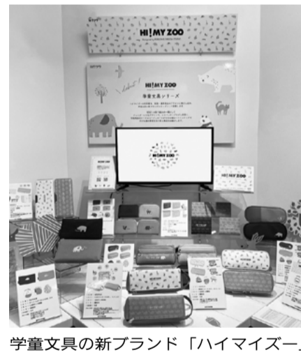
学童文具の新ブランド「ハイマイズー」

また、昨年末に発売した 学童文具シリーズ初の環境 に配慮した「アイコト」シ リーズが今年8月23日に発 売された「第17回キッズデ ザイン賞」(キッズデザイ ン協議会)を受賞した。 「アイコト」シリーズ 「アイコト」シリーズは、 「地球にイコト1つずつ」 をテーマに子どもたちの身 近にあり、学びをサポート する学童文具シリーズ。捨 てていたモノ(帆立殻、卵 殻、紙粉)を資源として再 利用した芯が見えて転がら ない「えんぴつキャップ」、 短くなつてしまった鉛筆を 挿して補助軸として使うこ とができる「キャップ&ホ ルター」をラインアップ。 商品を通して「地球にイ コトって何だろう?」と考 え、一緒に学び行動する きっかけづくりとなる商品 を提案している。