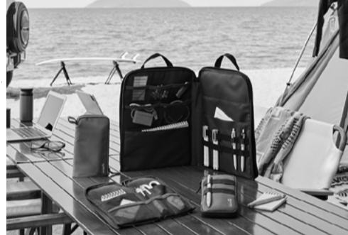
環境NGOとコラボした新シリーズ

クツワは、SDGsの実 践を強化した学童文具の新 ブランド「ハイマイズー」 を10月発売。 「ハイマイズー」は、「自 然のエコマ」をテーマにイ メージしたテキスタイルパ ターングラフィックスラン グで展開する。 同シリーズ の売り上げの 一部はサーフ ライダーファ ウンデーション ジャパンを 通じて、海の 環境保護活動 に役立てられ る。 オーション バンウンドプラ スチックと は、海岸から 50km以内の