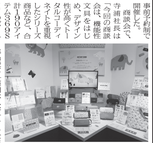
学童文具の新ブランド「Hi!My ZOO」

90期の節目となる今期は潤沢な新商品群で果敢にチャレンジする。今後も弊社は「品質と安全性」へのこだわりを堅持しつつ、ライフスタイルを彩る文具・雑貨の開発に注力していくと抱負を述べた。 会場では、新入学に向けて、学童・学生文具、学童用品をはじめ、マグネット筆入れ、ミラガク、ハイライオン、収納用品、プーマキャラクターなど多彩な新商品を発表した。 学童文具の新商品では、学童文具・通学用品の新ブランド「ハイ・マイ・ズー」を発表。「ハイ・マイ・ズー」は動物や自然をモチーフにしたテキストスタイルのブランドで、その世界観を文具・通学用品のデザインに落とし込み、学童文具の新シリーズとして展開する。テキストスタイル文具から進用品まで、学校用品のトータルコーディネートができる26アイテム59点をラインアップ。価格帯は消しゴム120円〜ウォレット2800円。 このブランドはサステナブルな観点から、売上の1