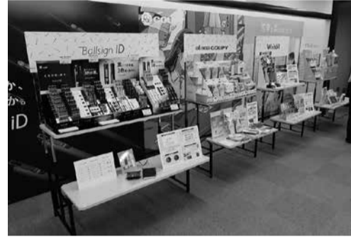
東京支店での秋冬新製品展示会

自己資本比率が3ポイント改善された。厳しい反面、明るいニューフェイスは、ベトナム工場が竣工し、その後、販売部門も設立して、元国営企業でトップクラスの大手文具メーカーとの代理店契約が成立、商品の競合がなくなり、お互いの販路が見込まれて将来に期待している。