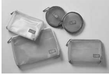
フラッティ シアア

株式会社キングジムは、かさばらないバッグインバッグ「フラッティ」の新タイプとして、メッシュ生地で軽やかに持ち運べる「フラッティシアア」を追加した。