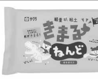
作品づくりの幅が広がる

素材のふせんを組み合わせたセットで、それぞれのふせんにテーマに沿った異なるイラストが描かれているため、推し仕草をたっぷり堪能できる。 ふせんは厚みのあるしっかりとした素材のため、メモとしてはもちろん、プレゼントにつけるメッセージカードとしても使える。 種類は「かみかみして甘える」「頭や体をスリスリスする」「ダンボール箱に入る」「おなかを見せる」「出迎える」「出迎えてくれる」「じーっと見つめる」の6種類。入数は、ふせん20枚×2種類。418円。税込。