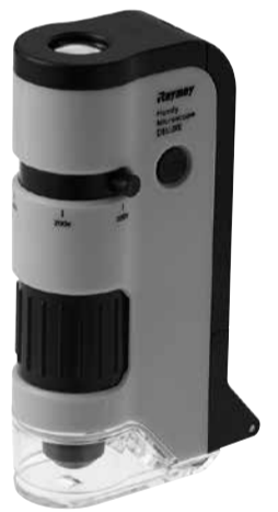
ハンディ顕微鏡新色

のカジエツト類のような厚みのある小物の収納に、LサイズはA5サイズの手帳や電卓などのビジネスアイテムやトラベルグッズなどの収納に便利。 カラーはピンク、キイロ、ミドリ、アオ、グレーの5色展開。Sサイズ800円、Mサイズ1150円、Lサイズ1450円。税別。