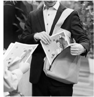
前面がナナメに開く新形状のトートバッグ

株式会社キングジムは、前面がナナメに開く物を出し入れしやすい新形状のトートバッグ「サットン」を5月10日より発売する。 従来のトートバッグは物の出し入れの際、肩から下ろしたり一時的にバッグを机などに置く必要があり、時間がかかるという不満があった。「サットン」は、前面についているファスナーが本体下