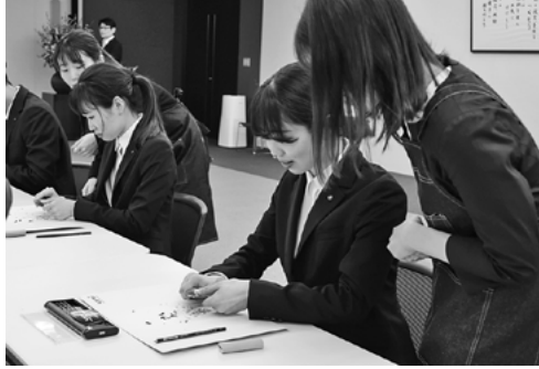
先輩の指導を受けながら鉛筆削りに挑戦

三菱鉛筆株 式会社(数原 滋彦社長、東 京都)は、4 月3日午前11 時から東京 都・品川区の 本社で、当日 出席の新入社 員15名を迎 え、「第16回 鉛筆削り入社 式」を開 催。新入社員 が、創業の原 点である「鉛筆」を先輩社員 に教わりながら小刀で削った ほか、今回初めて削った鉛筆 でデッサンにも挑戦した。