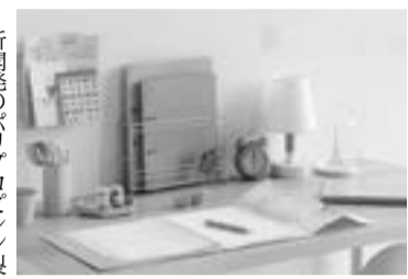
プリントルーサーーフバインダー

ペットの足形を作成 シャチハタ株式会社は、いぬ・ねこ用足形作成キット「ぺたっち」を応援購入サービス「Make」で1月27日より先行販売を開始した。 「ぺたっち」は、犬・猫の肉球を汚すことなく足形がと