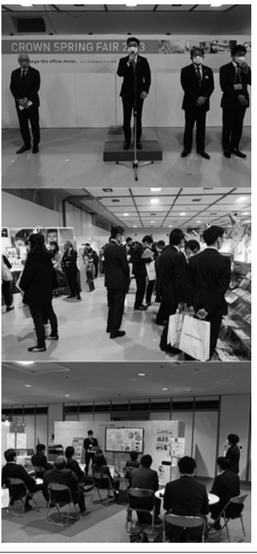
当日は8時50分から開会式を行い、青雲生社長が「リアルで開業できること、メーカー、販売店と交えることを嬉しく思う。今日来場する販売店は400社740人予定して、前には55社の出展社が3回に分けて社内事前勉強会を開催した。私も3回目に出席し、

株式会社青雲クラウド(青雲生社長、名古屋市中)の「CROWN SPRING FAIR」を2月2日(名古屋市中千種区の名古屋市中小企業振興会館第1・第2)で実施。展示場は、春の需要期に向けて多彩な商品で会場を飾ったほか、インボイス・電子帳簿保存法などの対策セミナーも交え、多彩な内容で展開した。 当日は8時50分から開会式を行い、青雲生社長が「リアルで開業できること、メーカー、販売店と交えることを嬉しく思う。今日来場する販売店は400社740人予定して、前には55社の出展社が3回に分けて社内事前勉強会を開催した。私も3回目に出席し、