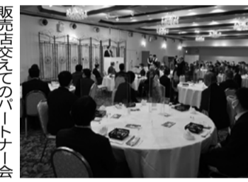
詰替用からケースへ手軽に詰め替え

（ふつかん）する加工方法など、新しい方法を取り入れながら、商品化した。現在、特許を出願中。 詰替用パッケージは厚さ4mmのスリムな段ボール板材にシャープ芯を収容し、段ボール板材の断面の穴に直接シャープ芯を収容し、詰替用パッケージとして活用するアイデアを具現化し、芯を封緘