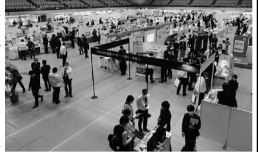
3事業部がミックスして多彩な商材提案

「2023フォーデック春のグランドフェア」を完全予約制で開催、10年に一度の寒波の影響により、一部地域（山陰、高知）の客足に影響したが、有力店148店、333人が来場し活発な商談を展開、前売・当日売上は計画を上回り、7億8452万円の実績を上げた。