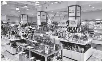
文具のしんぷく本店 鹿児島市上之園町9-8