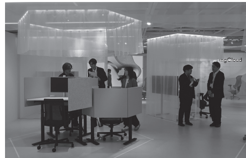
リニューアルされたシヨールーム