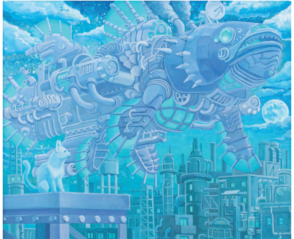
第34回写真表現部門 文部科学大臣賞「天空の深海魚」