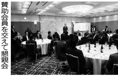
賛助会員を交えて懇親会

第1号議案の令和6年度通グループがOMMビルで「2024エコー見本市」を主催 ■5月29日、31日に東京ビックサイトで「第3回オルガテック東京2024」を開催 ■6月12日、14日に東京ビックサイトで「インテリアイフスタイル」を開催 ■6月20日に加藤憲クープが東京都立産業貿易センター浜松町館で合同見本市 ■7月3日、5日に東京ビックサイトで「ISOIT」など10の専門展で構成された総合展「ライフスタイル W.E.K.」を開催 ■7月9日にエコーマイインドがOMMビルで「エコービックコレクション」を開催 ■7月9日、10日に共和フォーラムで「第38回2024年夏の文紙フェア」を開催。第29回文紙フェア大