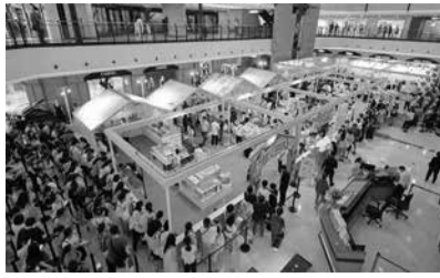
前回の上海コクヨ博

店舗やオフィスなどで利用が見込める場所、原則屋内(電源が必要)。設置した自販機の電気料金は土地オーナー負担。地味は月々1万円(税別)で、土地オーナーは売上実績にかかわらず安定的な収入を得られる。なお、設置およびその後の商品補充や代金回収、メンテナンスなどは全て同社が担当。