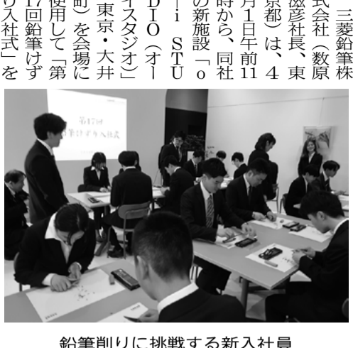
鉛筆削りに挑戦する新入社員

三菱鉛筆株式会社(数原滋彦社長、東京都)は、4月1日午前11時から、同社の新施設「Ooi Studio(オーイスタジオ)」(東京・大井町)を会場に使用して「第17回鉛筆けずり入社式」を開催した。