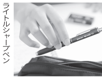
シャープペンシル

○：シャープ シャープは、ペン先を完全に収納できる「書きやす」シリーズに、シナプス&スイートなテキストの「シャープペンシル」を発売。