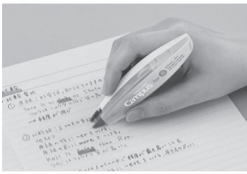
持ち手が長いペン型タイプ

○：コクヨ コクヨは、キャンパスノートの中紙の色とテープ幅を調整した修正テープ「キャンパスノートのための修正テープ」に、握りやすく、狙った文字を消しやすいペン型タイプをラインアップ。