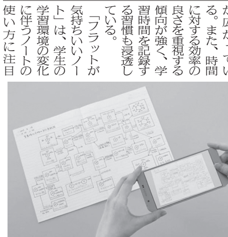
影ができずに撮影できるフラット製本

○：コクヨ コクヨのキャンパスノートから史上最高にフラットに開く綴じ製法を採用した「キヤンパスフラット」が