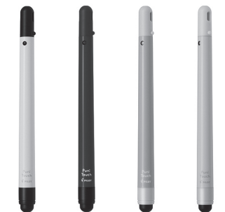
小学生向けタッチペン

タッチペン「Puni Touch」(フニタッチ)は、筆記具メーカーが使いやすさにこだわって開発したICT教育時代の小学生向けタッチペン。先端のタッチ部に向かっただけの握りやすいデザイン形状や、デジタル端末との接地面が広く感度の良い8mm径のタッチゴムを先に採用するなど、書きやすさにこだわって、文字を学び始める小学生1年生にも使 紙の厚さ自体は従来品と同等となっており、文字の裏写りに影響はない。 ノートの表紙デザインは、人気イラストレーター「米津祐介氏のクレパス画」を採用。 《154円(税込)》