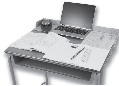
アスカの学校机の作業スペース拡張ツール

○：アスカ アスカは、タブレットやノートパソコンを使った学習シーンでの「学校机が狭い問題」を解決する「拡張デスク」(落下防止機能付き)を発売。 「拡張デスク」は、「机が狭くてパソコンやタブレット、文具が落ちそう」になる「学校机が狭い問題」にフォーカスして商品化。学校机に拡張デスクを取りつけることで、机を約8cm拡張することが可能になり、