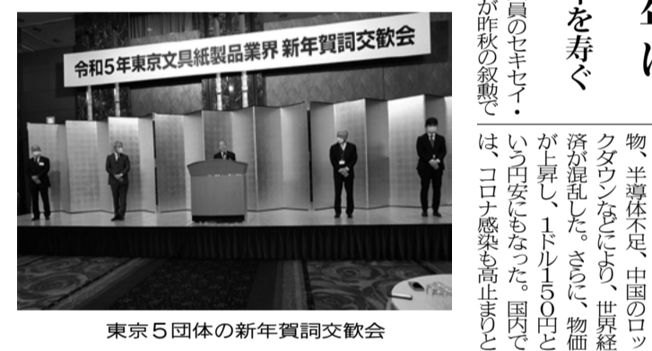
東京5団体の新年賀詞交歓会