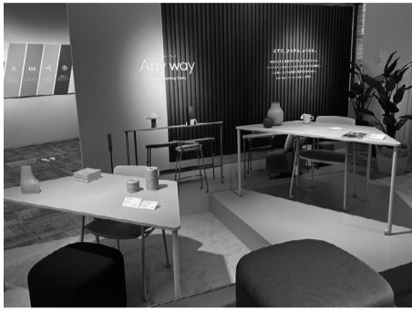
カラフルで軽量の家具「エニウェイ」

コクヨ株式会社(黒田英邦社長、大阪府)は、ファンチャー新製品とオフィス空間働き方を提案する「2023 KOKUYO FAIR」を、東京(11月7~18日)コクヨ東京品川オフィスTH E CAMPUS)に続いて、