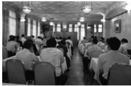
ぶんぐフェスタ出展社説明会

京都文紙事務用品組合(島)は、8月26日午後5時半から祇園四条のレストラン菊水で、来月22日に開催される「ぶんぐフェスタ2023」の説明会と納涼会を開催、組合員と賛助会員50人が出席した。 説明会に先立ち、島理事長は「きょうぶんぐフェスタを3年振りに開催する。前回までは画材展の京都アートメッセと同時に開催だったが、同展が休止となったため、京滋BSとの連携事業として来月2月に開催することを決めた。これまで